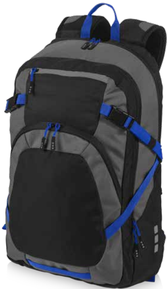
Milton outdoor backpack 12012300