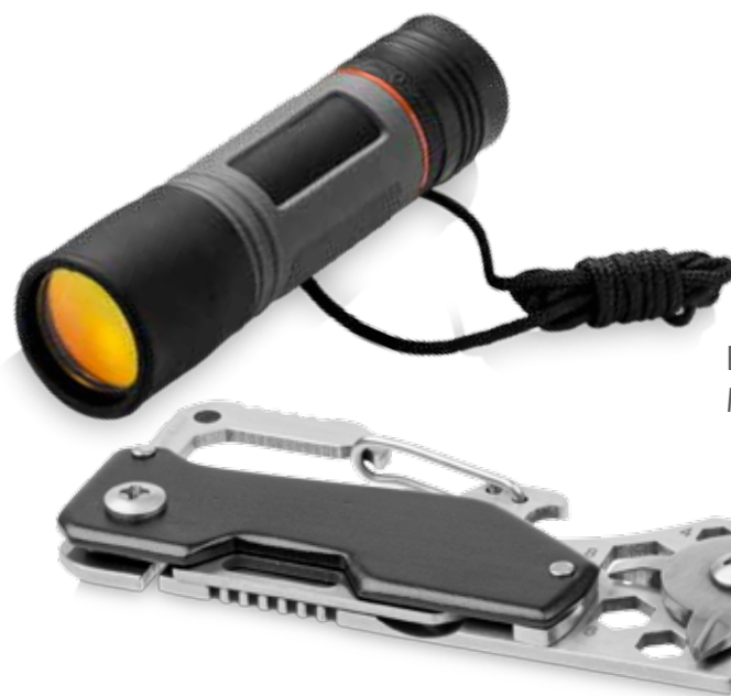
Elevate kikare 13401300 + Multi function tool 10430400