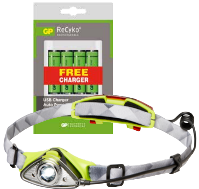
Sunmatic pannlampa Populus 455006 + GP ReCyko+ 4-pack AA-batterier med laddare 202202